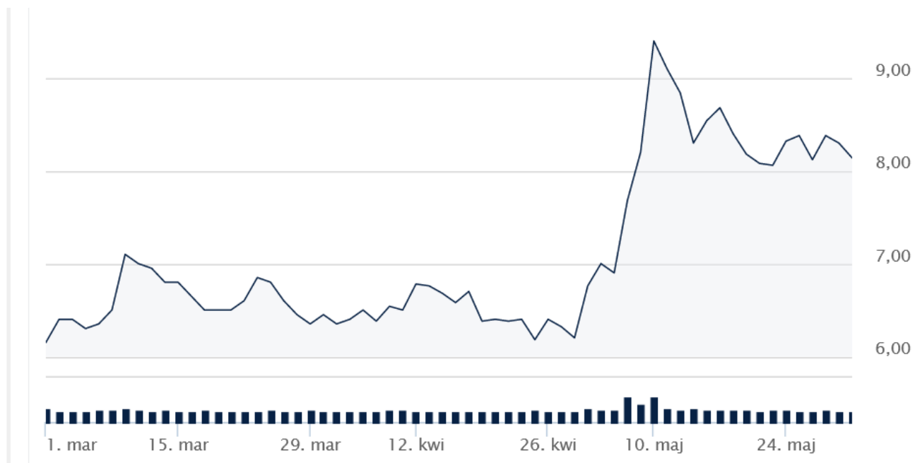
Wykres notowań akcji Ekopolu Górnośląskiego Holding SA w II kwartale 2021 roku.

Spółka zadebiutowała na rynku akcji GPW NewConnect 27 sierpnia 2008 r. pozyskując w wyniku oferty prywatnej 1,78 mln zł przy konieczności poniesienia kosztów w wysokości 190 tys zł. Zgromadzony kapitał został przeznaczony na dokończenie budowy budynku administracyjno-biurowego oraz dofinansowanie inwestycji w wydziałach produkcyjnych.