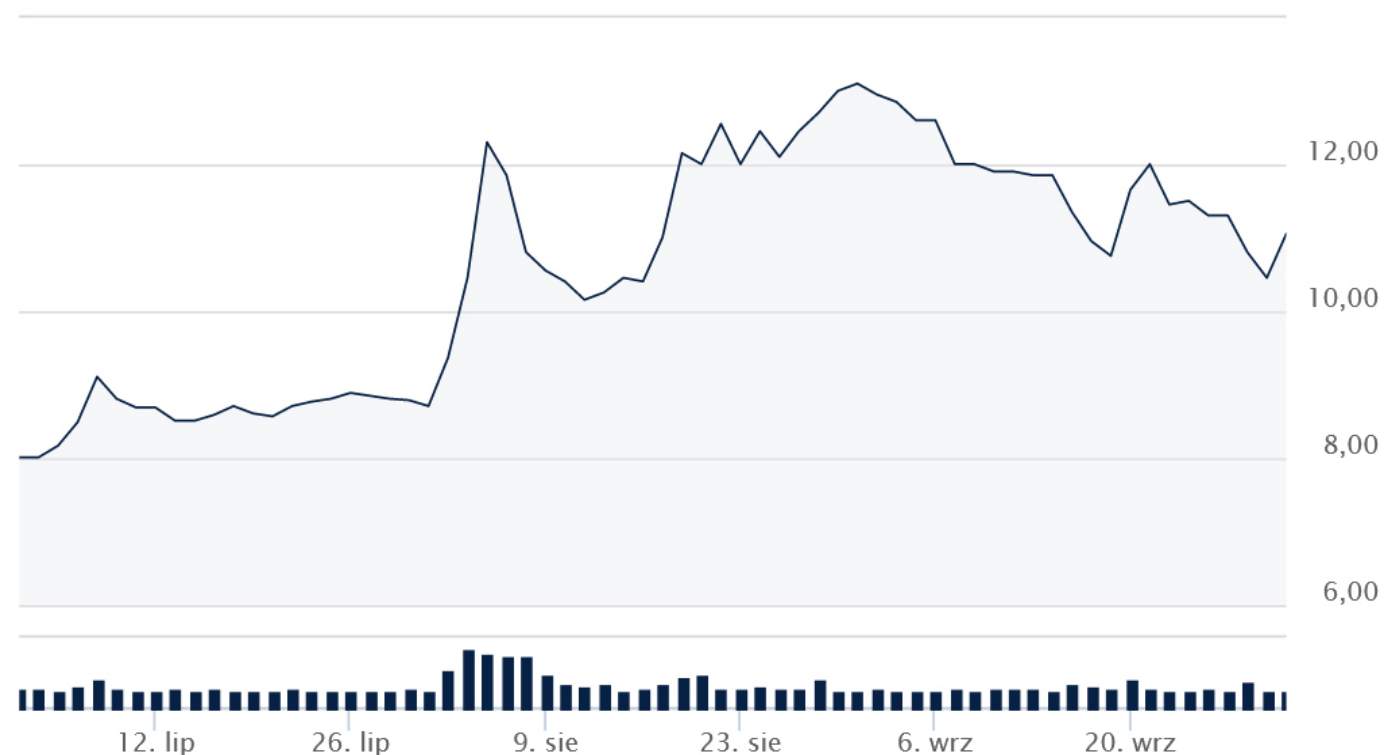
Wykres notowań akcji Ekopolu Górnośląskiego Holding SA w III kwartale 2021 roku.

Spółka zadebiutowała na rynku akcji GPW NewConnect 27 sierpnia 2008 r. pozyskując w wyniku oferty prywatnej 1,78 mln zł przy konieczności poniesienia kosztów w wysokości 190 tys zł. Zgromadzony kapitał został przeznaczony na dokończenie budowy budynku administracyjno-biurowego oraz dofinansowanie inwestycji w wydziałach produkcyjnych.